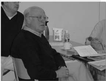
Interview mit Willi Sack

Auschwitz umgebracht worden ist. Als Heß in Wunsiedel begraben wurde, wurde das Grab auf Wunsch der Enkel nach Pilsen auf den dortigen jüdischen Friedhof verlegt.