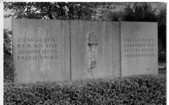
Grab der 30 namenlosen Opfer

"Deutschland muss leben, und wenn wir sterben müssen" (Heinrich Lersch 1915)